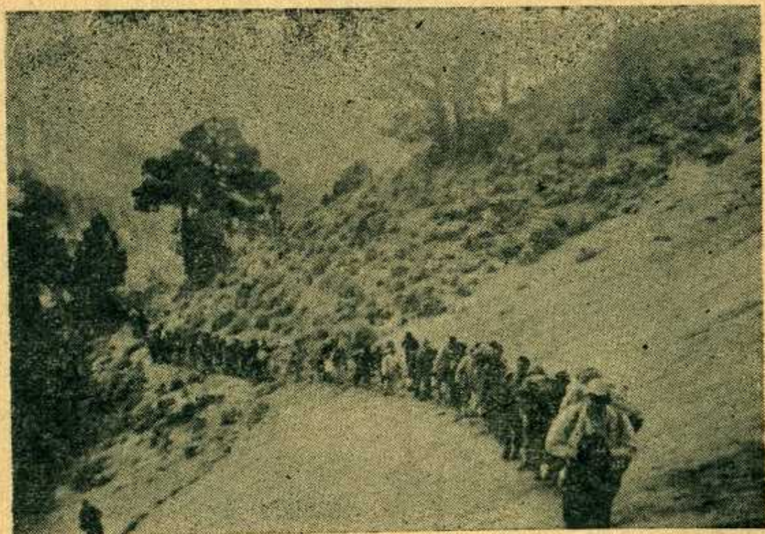
Los excursionistas participantes en la Confraternidad, durante el ascenso al Volcán de Colima.

Marzo 21-22. Intento de escalamiento del Pico Sur, subiendo por la Cuneta.