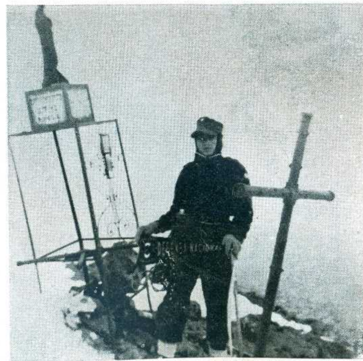
Saúl Ramírez Galicia del "Defensa Nacional" en el labio superior del Popocatépetl, Foto de Montenegro.