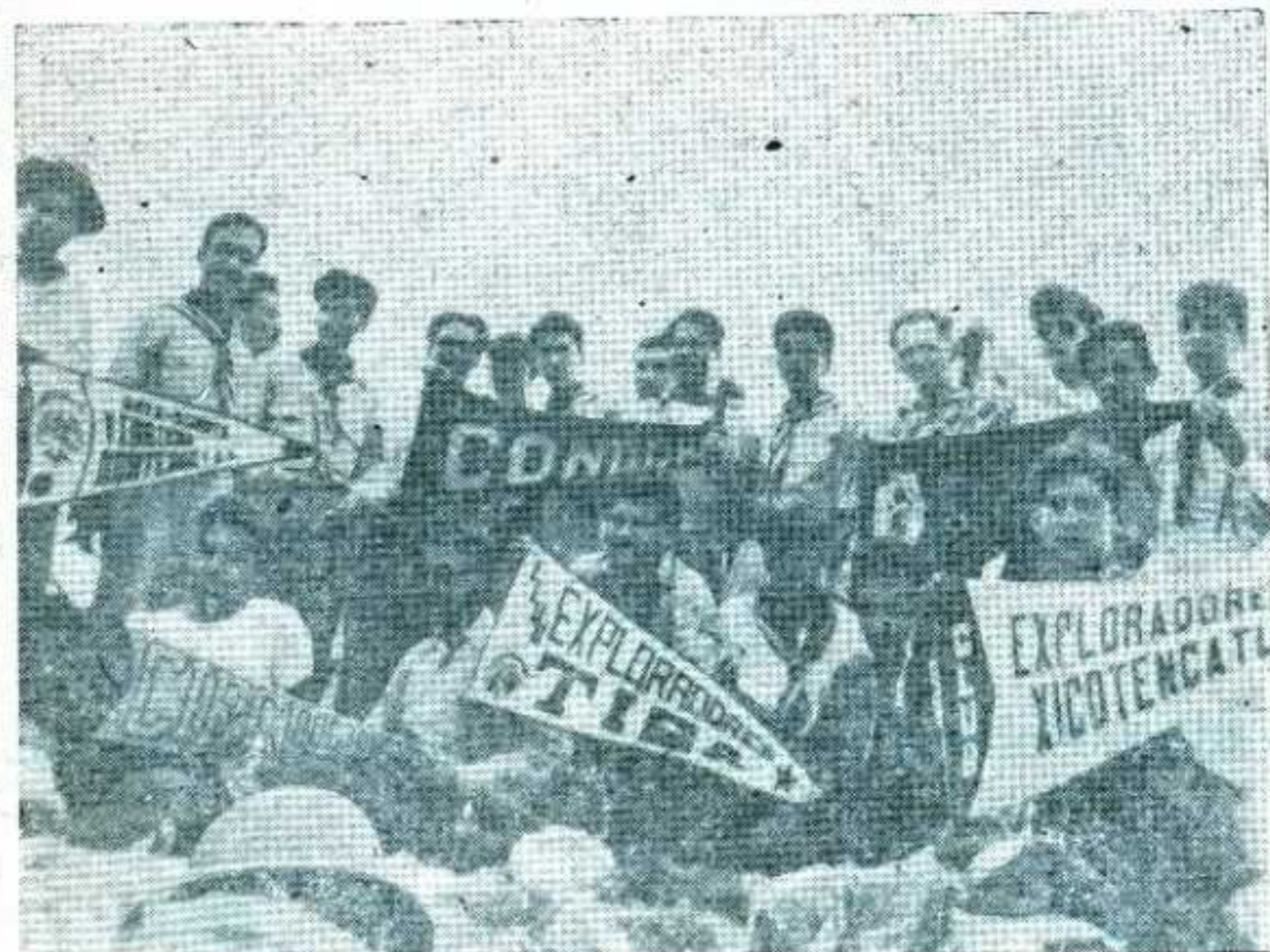
Foto tomada en el asta-bandera del Cerro de la Silla, donde intercambiamos con los Clubes Ah-Kin-Pech de México, D. F. y Xicotencatl de esta ciudad, durante los días de la Semana Mayor.

El principio básico del radar es la propiedad de las ondas ultra-cortas de conducirse de una manera semejante a las ondas lumínicas. En el espectro de las ondas electromagnéticas, que se extienden desde los rayos gamma, rayos que tienen una longitud de onda del orden de unas diez mil millonésima de centímetro, hasta las larguísimas ondas de una planta de energía eléctrica, con longitud de diez mil kilómetros. Las ondas luminosas y las ondas de radar (1). Existe sin embargo entre